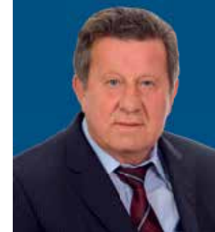
Slavko Tušek, predsjednik HAK-a

Aktualnu 2021. godinu pamtit ćemo i po otvaranju prometnog vježbališta i biciklističkog poligona u Kutini te tehničke baze i prometnog vježbališta u Gospiću. To su investicije koje jasno određuju našu orijentaciju - Hrvatski autoklub je prisutan na cijeloj teritoriji države